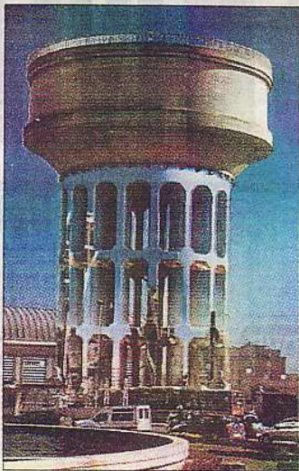
El depósito de plaza Castilla, obra de arte.

→ ETOY | El colectivo suizo convierte Colón en una oficina para investigar el mercado del arte. ☛ JARDINES DEL DESCUBRIMIENTO