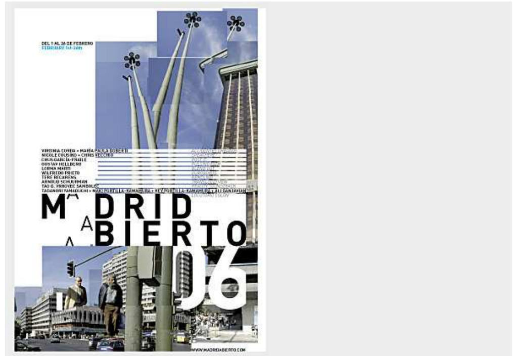
Portada de periódico. Ejemplo de aplicación.

Con todo, este trabajo no deja de ser el tradicional diseño del cartel para las fiestas del pueblo. Así que, a pesar de estos pensamientos que han acompañado su elaboración, ahora en voz alta (o en letra impresa), al final lo más importante podría ser la capacidad para captar la atención con sentido del humor e ironía.