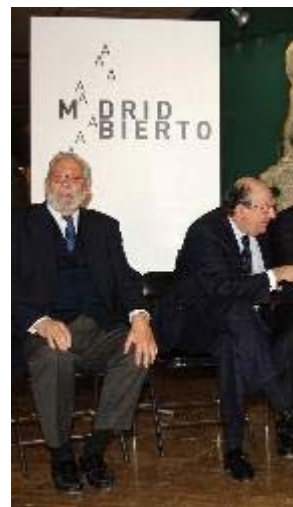
EP - "Madrid Abierto" saca a las calles de la capital los proyectos de diez artistas internacionales

"Ouroboros", del cubano Wilfredo Prieto, es una grúa de enormes dimensiones,