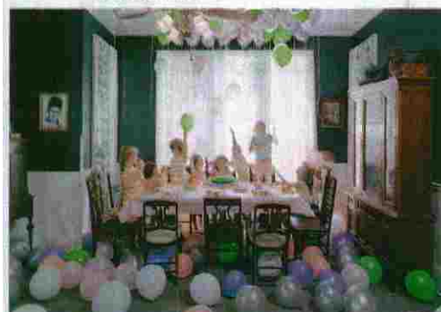
ANGELA STRASHEIM. «BIRTHDAY PARTY».

París). Ambos han seleccionado 12 proyectos que vienen de Alemania, Austria, Portugal, Reino Unido, Italia, Suiza y España.