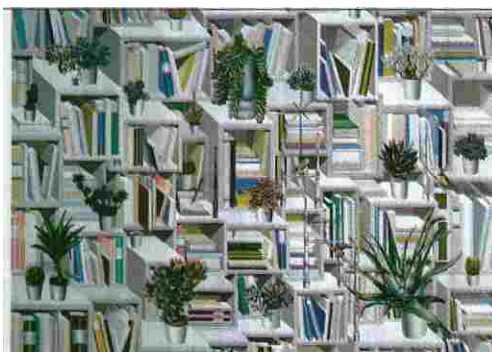
K. TACK HONG. «LIBRARY WITH CACTUSES».