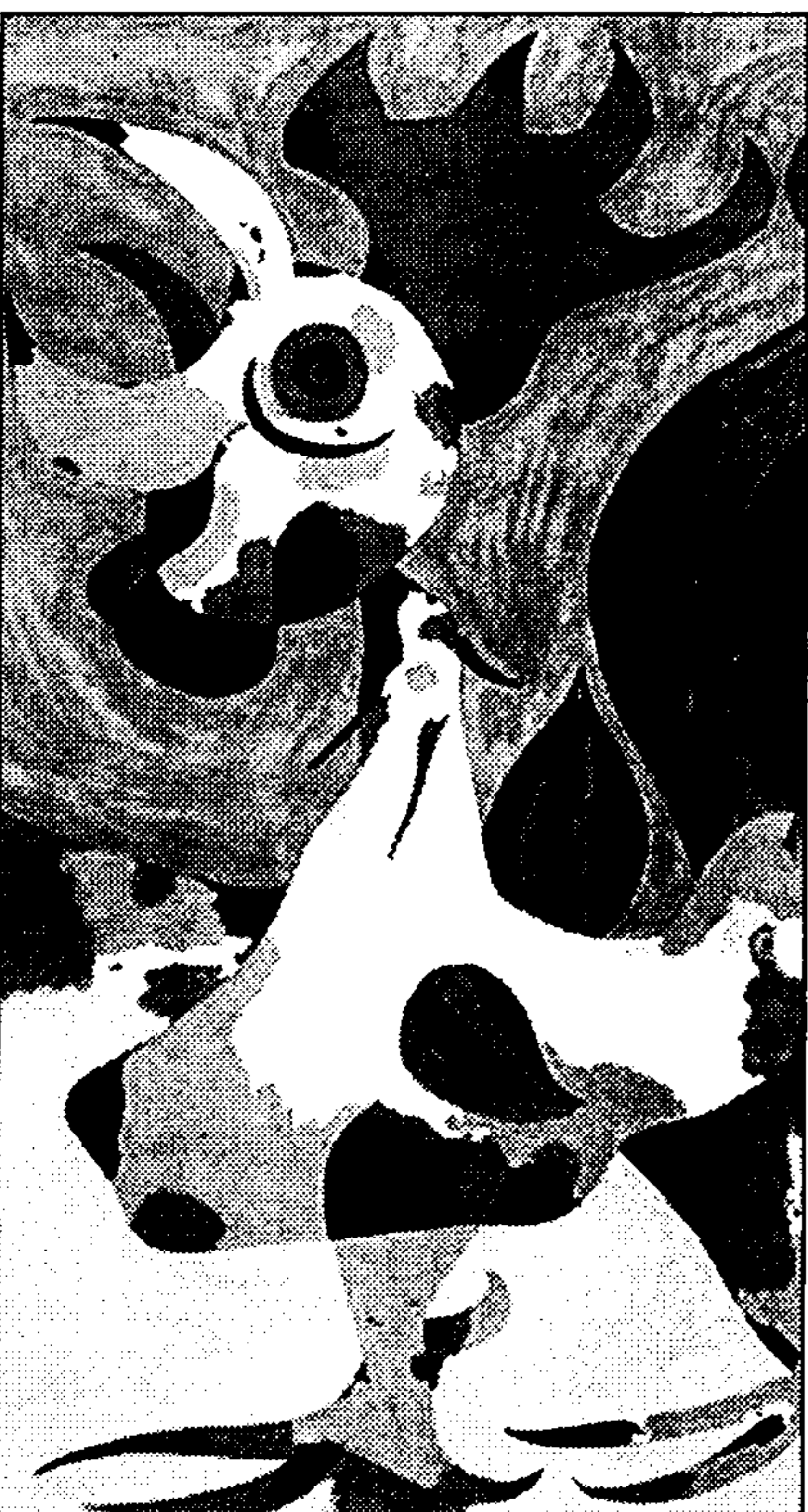
Un dibujo de Miró

Según el acuerdo, el personal de la Fundación Miró se encargará de la manipulación de las obras, que por sus características exigen "la máxima precaución y delicadeza", y un profesional de Telefónica manejará un escáner de última generación. □