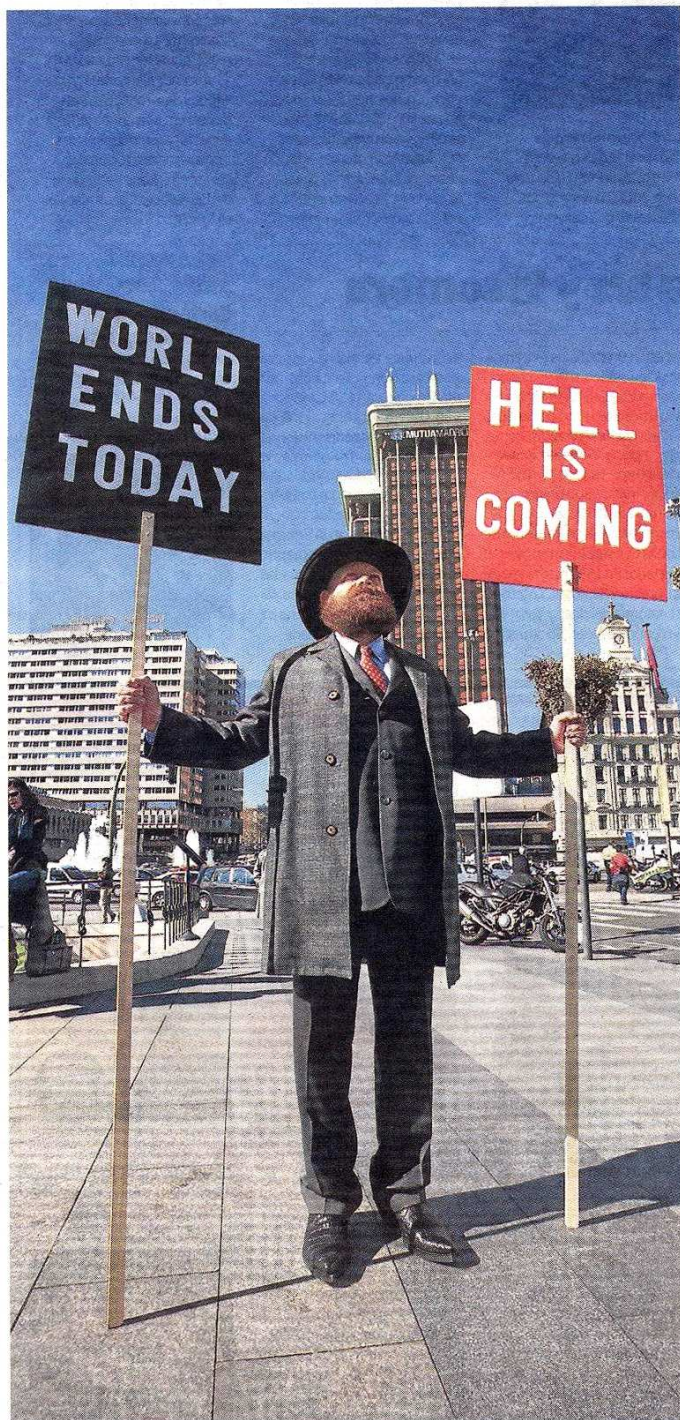
Templin propone sacar a la calle a éste hombre apocalíptico. PÚBLICO

Trece artistas salpican de arte el eje Castellana-Recoletos-Prado en la cita callejera más importante de Madrid// La quinta edición aborda los puntos oscuros de la ciudad