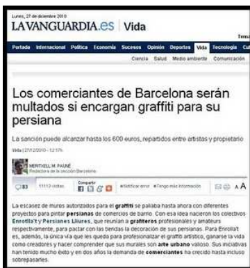
Barcelona multará a quien encargue graffiti para sus cierres

Suscríbete a Escrito en la pared (¿qué es esto?):