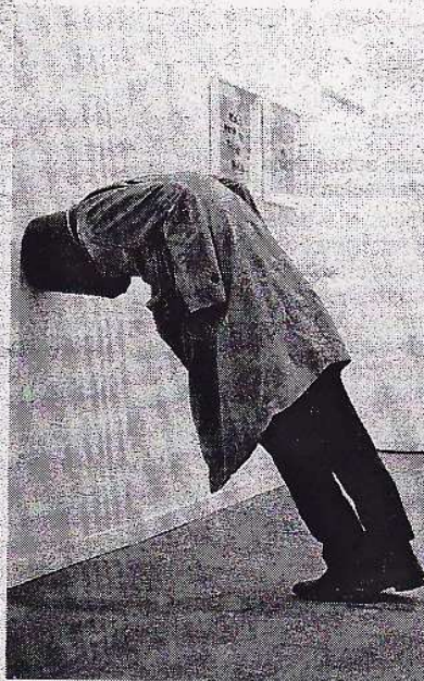
Una de las obras expuestas en la última edición de ARCO

En este sentido, indicó que, un año más, la Comunidad de Madrid estará