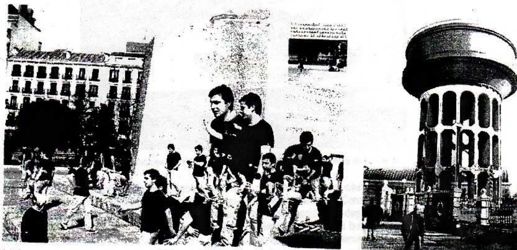
A la izda., imagen corporativa de Madrid Abierto 2004 . A la dcha. el depósito de la Plaza de Castilla, que acogerá el proyecto Sans Façon