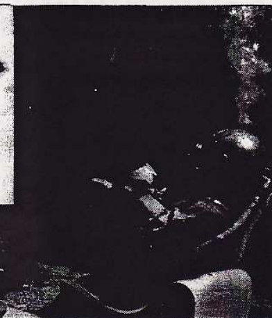
EL BRITÁNICO Cliff Richard es el cantante que más «singles» ha vendido en la historia del Reino Unido: casi 21 millones, por delante de titanes como «The Beatles» y Elvis Presley.