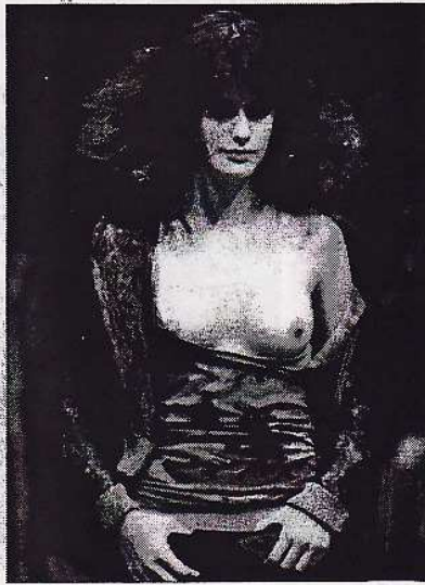
PROPUESTA PARA UN INVIERNO SUAVE. Modelo de otoño-invierno presentado por Alviero Martini en Milán.