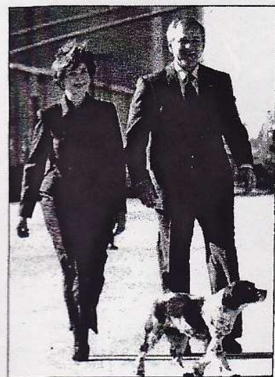
George W. Bush y su esposa Laura, paseando a «Spot», su perra spaniel, sacrificada por su mala salud.