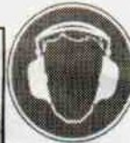
Proyecto de la instalación sobre la Casa de América. Arriba, el logo que identifica los taxis intervenidos.