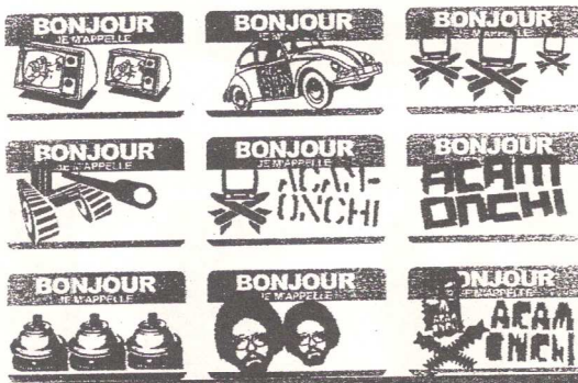
Detalle de 'Instalación', de Accmonchi, en la muestra 'Tijuana Sessions'.

La sala Alcalá 31 ha preferido escoger a una serie de creadores visuales de la frontera para sus Tijuana Sessions , exposición comisariada por Taiyana Pimentel y Priamo Lozada (del 8 de febrero al 10 de abril). Este último se encarga también de Dataspace , en el Centro Cultural Conde Duque (Conde Duque, 9), donde, además de las piezas de nueve artistas, se propone un espacio público de debate y encuentro en torno al arte y las nuevas tecnolo-