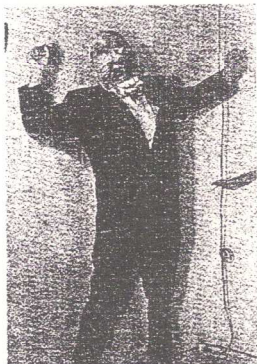
Imagen de la exposición 'Iconofagias'.

de Madrid Abierto que lleva hasta el 27 de febrero a las calles de la capital otros ocho trabajos seleccionados.