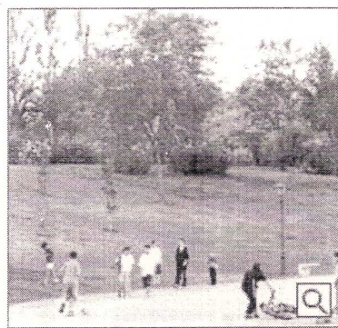
El parque Pradolongo es parte de un recorrido alternativo por Madrid

>> Un tour por Usera es parte de una exposición