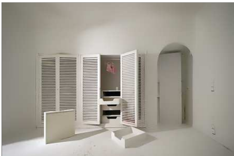
Obra de David Latorre, pieza expuesta en Art Madrid.

La capital vive su semana más artística del año. ARCO es la gran cita, por tamaño, afluencia (200.000 visitas en 2009) y relevancia internacional. Pero en Madrid no hay sólo una feria de arte durante los próximos días, sino cinco, todas ellas consagradas al arte contemporáneo. [ PDF: Toda la programación ].